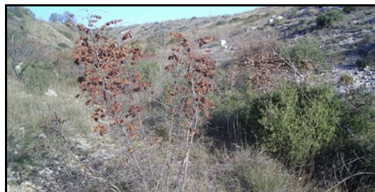
Le Ruisseau du Valat de la Fosse serpente dans un paysage aride au niveau de Courpouyran. La densité de Paliures le rendent impénétrable