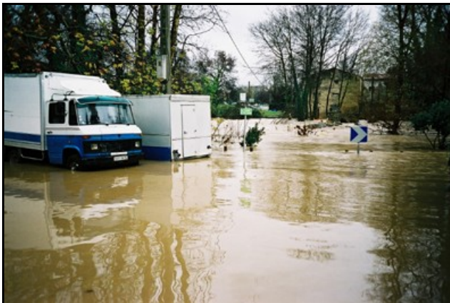
La Mosson en crue. Le pont roman est presque totalement sous les eaux qui s'épanchent dans la rue montante vers l'ancienne mairie.

Courpouyran, dont il prend désormais le nom, jusqu'à son exutoire dans la Mosson, non sans avoir présidé à la formation de sites remarquables mais peu valorisés jusqu'ici et parfois soumis à différentes pollutions et même menacés de disparition. Le ravin de la Combe du Renard, totalement artificialisé et qui se jette dans le ruisseau de la Fontaine de Courpouyran, demeure encore très méconnu, comme le ruisseau de Fontcaude qui traverse le petit lac artificiel du golf avant de rejoindre la Mosson près du Mas de Fontcaude où existe encore un bassin, jadis peuplé de canards et alimenté par ce ruisseau.