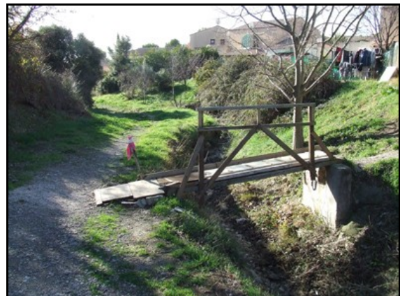
Entre colline du golf et lotissements, le ruisseau très artificialisé de la Combe du Renard rejoint le ruisseau de la Font. de Courpouyran.